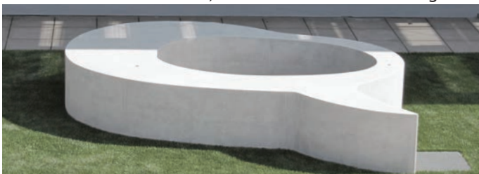
IGS Bretzenheim, Kunst: Upper Bleistein