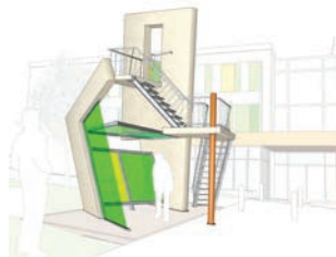
Glantalklinik Meisenheim, Kunst: www.conheroes.org